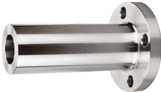
LONG WELD NECK FLANGE