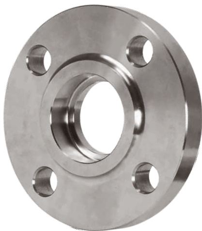
SOCKET WELD FLANGE